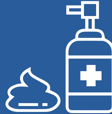
Alcohol en gel