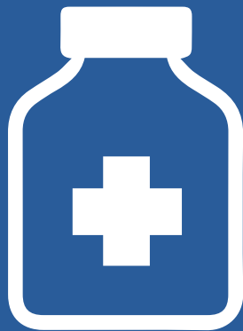
Alcohol a 70°