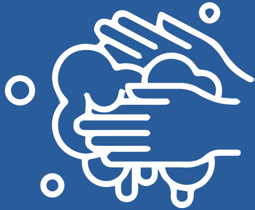
Lavado de manos